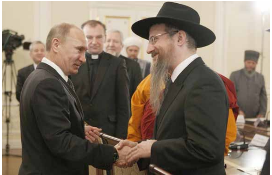
Vladimir Poetin met Rabbijn Lazar

De Joodse revolutionaire beweging was gevoed door de drang naar rechtvaardigheid en gelijkheid van een bevolkingsgroep die zwaar te lijden had onder de voortdurende pogroms van de tsaristische Kozakken en het staatsantisemitisme van het regime. Centrale Magazine - 18